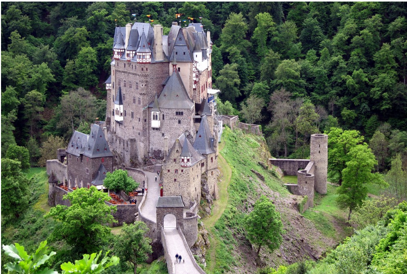
Burg Eltz im Eltztal bei Wierschem im Landkreis Mayen-Koblenz (2014)