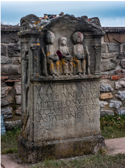
Replik eines Weihsteins der Aufanischen Matronen am Matronenheiligtum "Görresburg" im Archäologischen Landschaftspark in Nettersheim (2026).