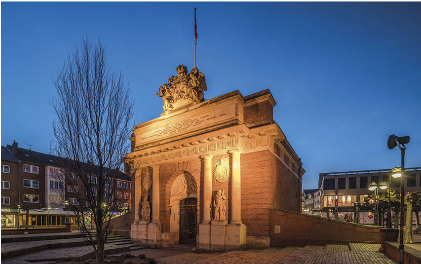
Berliner Tor in Wesel (2019)