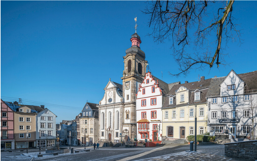
Marktplatz in Hachenburg (2022)