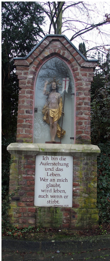
Bildstock auf dem Friedhof in Bornheim-Brenig (2016)