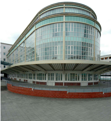
Kölnisch Wasserfabrik Ferdinand Muelhens (4711)