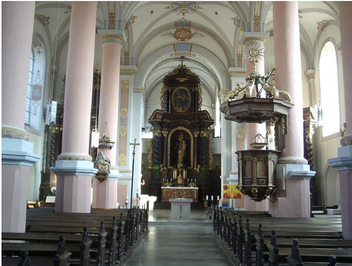
Das Innere der katholischen Pfarrkirche St. Joseph in Beilstein an der Mosel (2007).