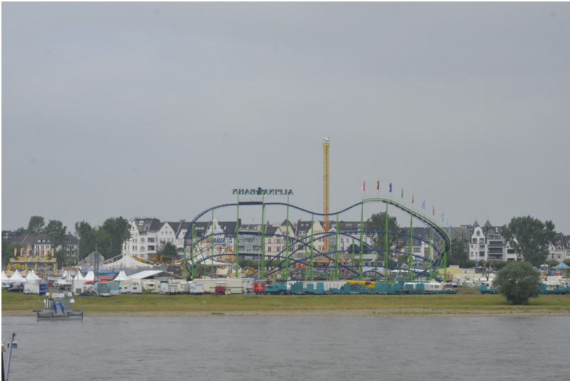
Die Rheinkirmes in Düsseldorf auf den Rheinwiesen vor Oberkassel. Sie findet jährlich statt und wird vom St. Sebastianus Schützenverein Düsseldorf 1316 e.V. ausgerichtet