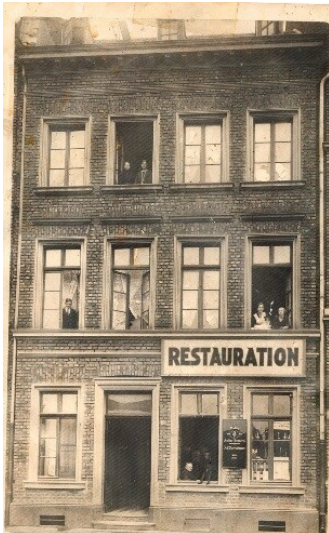
Das vermutlich Anfang des 20. Jahrhunderts erbaute Gebäude der späteren Gastwirtschaft Lommerzheim im Jahr 1924