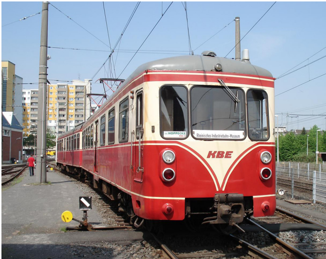
Frontansicht des Doppeltriebwagens ET 57 im Rheinischen Industriebahnmuseum in Köln (2012).