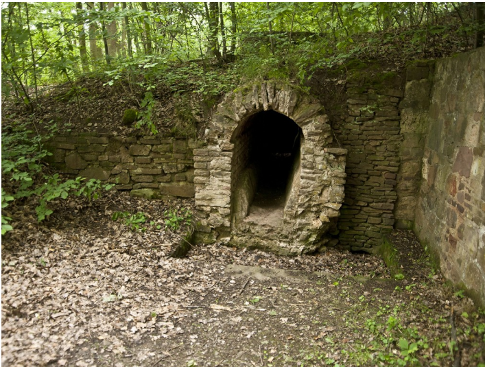
Kanalmeisterei der römischen Wasserleitung in Breitenbenden (2012)