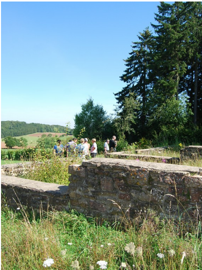
Besucherguppe an der römischen Hofanlage in Roderath (2012)