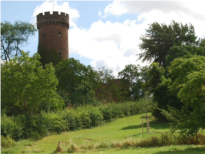
Landesburg Zülpich