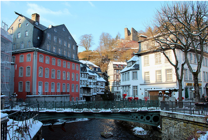
Das Rote Haus in Monschau, daneben Altstadt Häuser, die Ruinen von Haller und die Brücke über die Rur (2013).