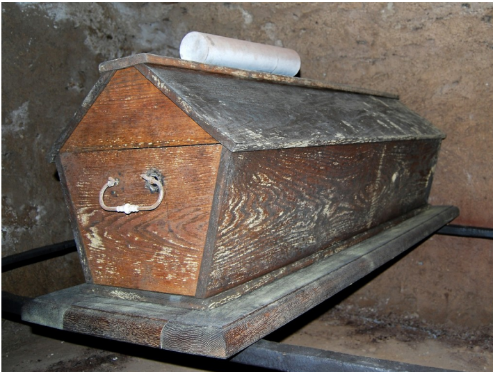
Kirche Sankt Matthias in Reifferscheid, Sarg in der Gruft (2012)