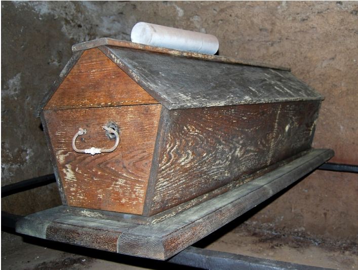
Kirche Sankt Matthias in Reifferscheid, Sarg in der Gruft (2012)