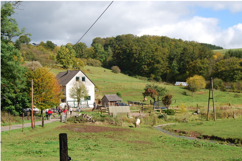
Obermühle am Glaadtbach (2012)