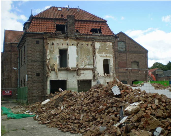
Kleutgen und Meier Bonn, abgerissener Gebäudeteil (2012)