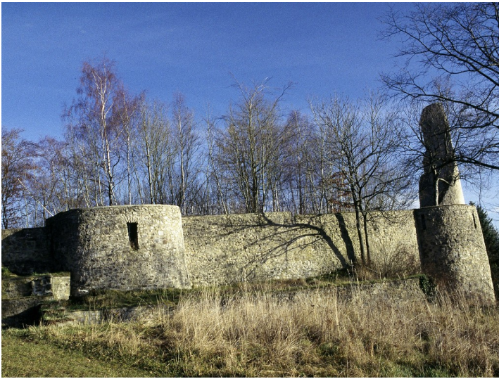
Burg Dollendorf (Schloss Dahl) in Dollendorf-Schloßthal (1997)