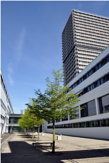
Innenhof des sogenannten Schürmann-Baus, des Sitzes der Deutschen Welle in Bonn (2015)