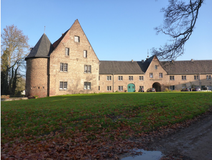
Fassade vom Innenhof (2017)