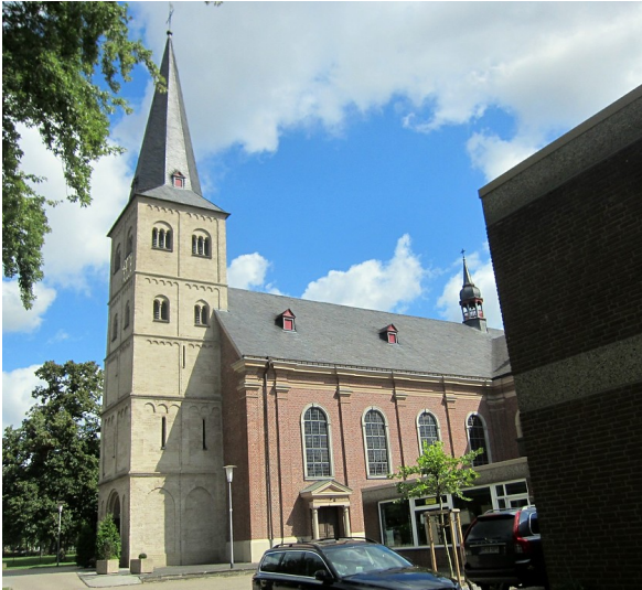
Die Pfarrkirche Sankt Stephanus in Elsen von Süden gesehen (2014)