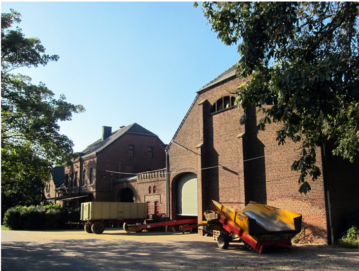
Hof Gut Norbistrath, ehemaliger Rittersitz bei Neukirchen-Hülchrath (2014)