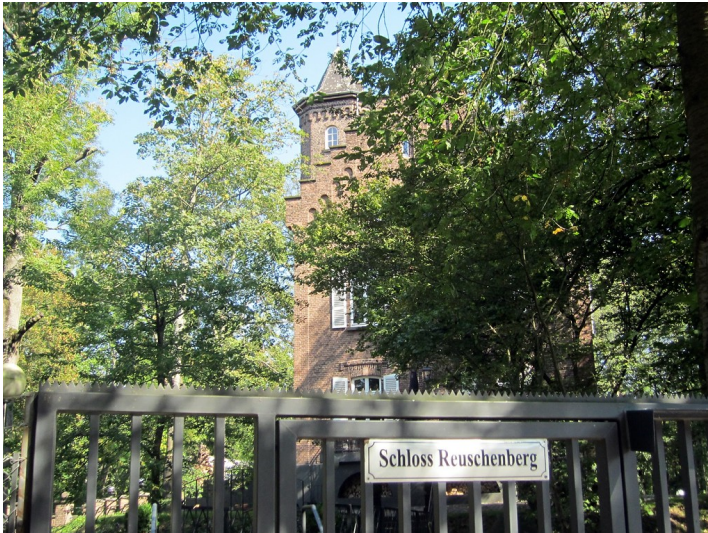
Das Eingangstor zum Schloss Reuschenberg und einen Teil des Schlosses (2014)