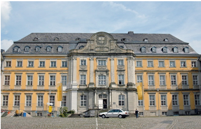
Das ehemalige Hauptgebäude der Abtei Werden, heute eines der Hauptgebäude der "Folkwanghochschule", der Folkwang Universität der Künste in Essen-Werden (2010).