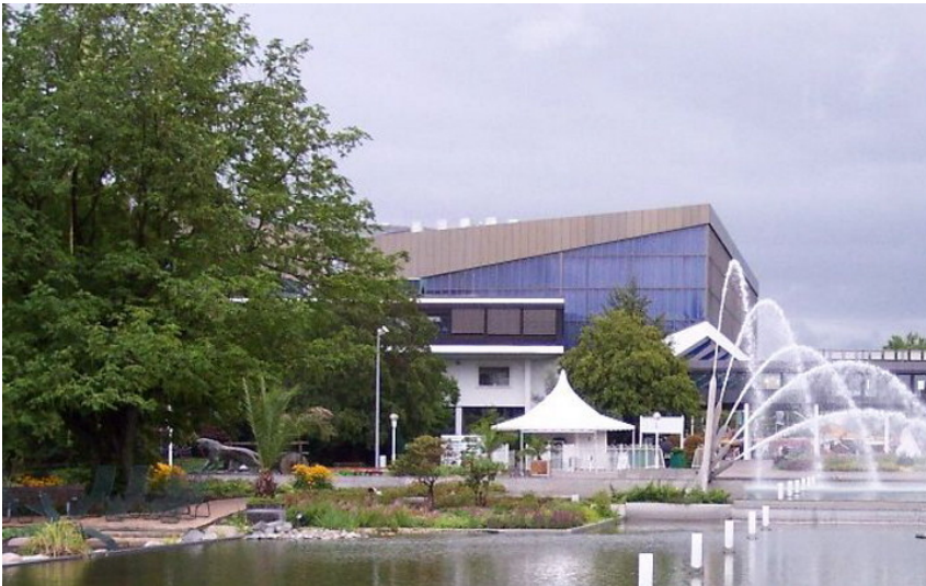
Die Grugahalle im Essener Gruga-Park (2010).