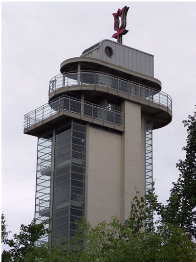
Der Grugaturm im Gruga-Park in Essen (2005).