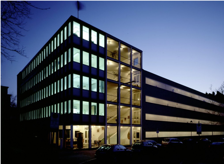
Am Abend beleuchtetes Jugendhaus Düsseldorf (2009)