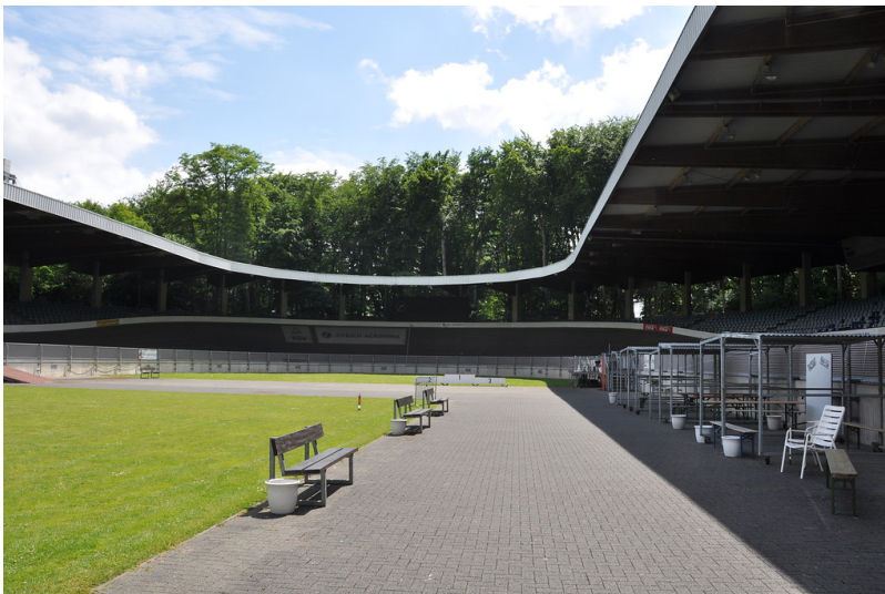
Innenbereich der Albert-Richter-Bahn in Köln-Müngersdorf (2012).