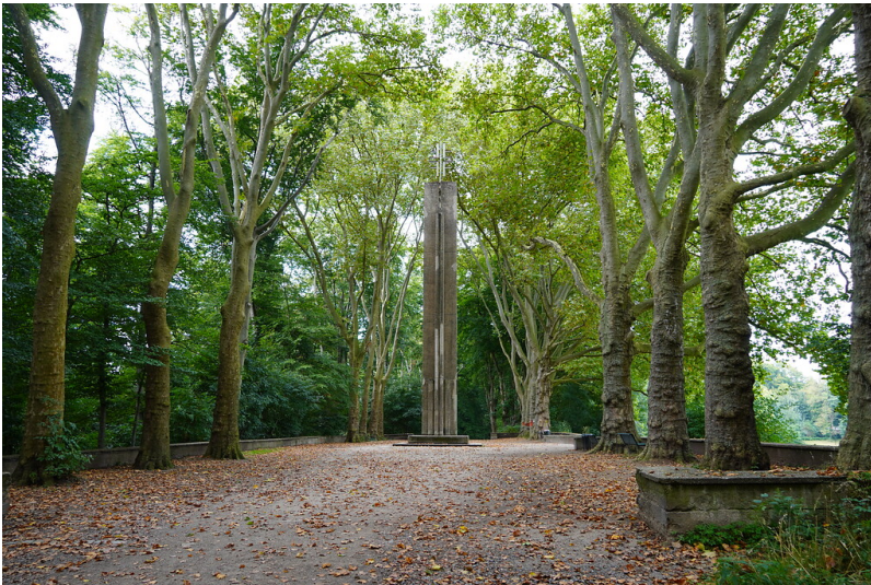
Das Jahndenkmal in Köln-Müngersdorf (2021)