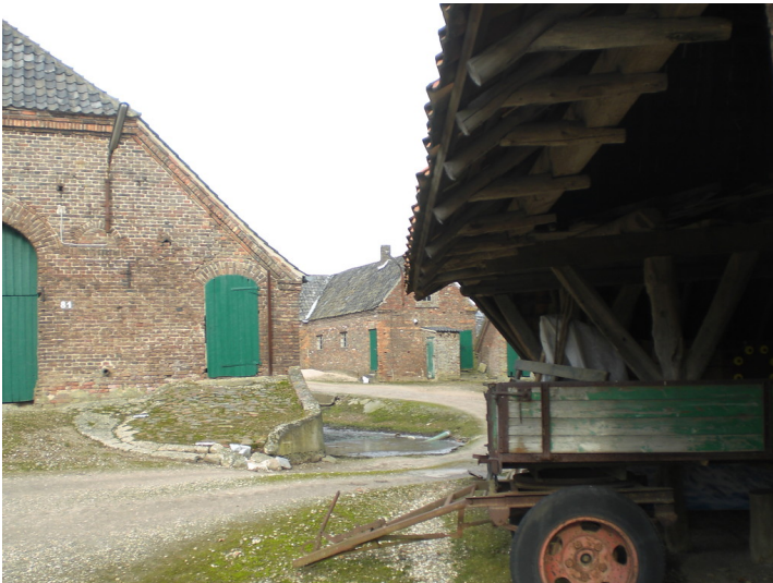
Hofanlage Hollandshof in Kalkar