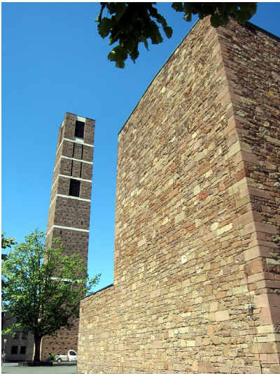
Annakirche Düren (2012)