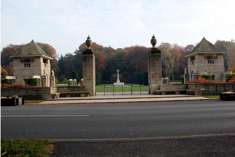
Eingangsbereich zum Britischen Ehrenfriedhof im Reichswald in Kleve (2012)