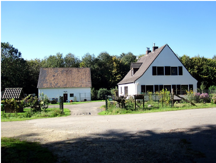
Forsthaus Nergena Nord bei Kranenburg (2011)