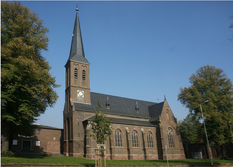
Pfarrkirche St. Sebastianus in Königsdorf