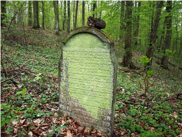
Grabstein auf dem Jüdischen Friedhof im Fürstlich Elzer Wald, Wierschem (2010)