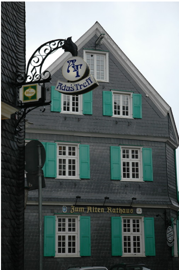
Schieferfassade in Lennep