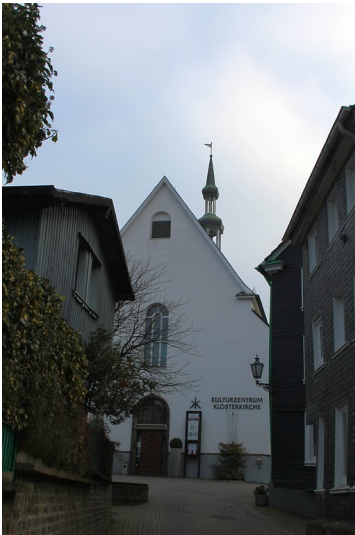
Kulturzentrum Klosterkirche in Remscheid-Lennep (2016).