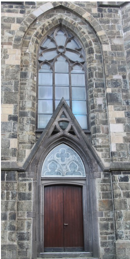
Sankt Bonaventura in Remscheid-Lennepe (2016).