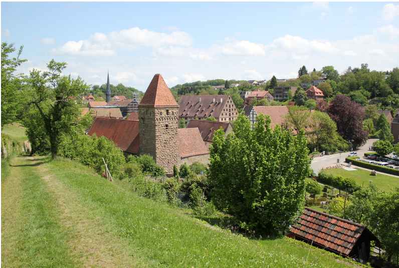
Blick auf die Nordseite des Klosters Maulbronn mit dem Hexenturm und dem Dachreiter der Klosterkirche im Hintergrund (2012)