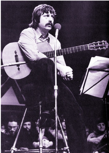
Der DDR-Liedermacher Wolf Biermann am 13. November 1976 auf der Bühne der Sporthalle Köln-Deutz.