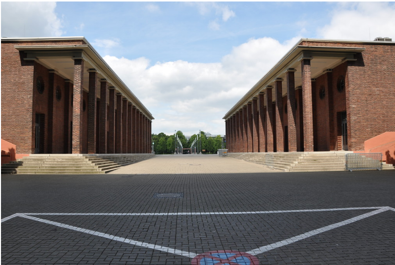
Backsteinbauten vor dem RheinEnergieStadion vom Stadion aus gesehen