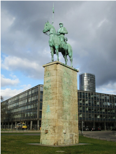
Das Kürassier-Denkmal bzw. „Lanzenreiter“-Denkmal des Kürassier Regiments Nr. 8 in Köln-Deutz nach seiner 2018 abgeschlossenen Sanierung (2022), im Hintergrund das LVR-Landeshaus und das Hochhaus KölnTriangle.