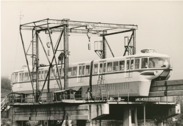
ALWEG-Bahn in Köln-Fühlingen: Montage des für die Jahrtausendausstellung in Turin entwickelten Modells "Italia 1961" (1960/61).