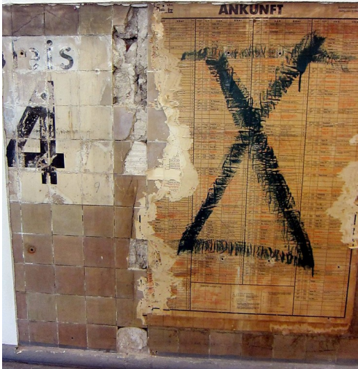
Fahrplan und Bahnsteighinweis im Deutzer Bahnhof (01.12.2012)