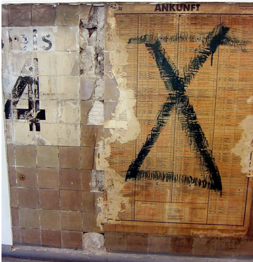
Fahrplan und Bahnsteighinweis im Deutzer Bahnhof (01.12.2012)