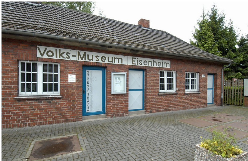
Museum Eisenheim (LVR-Industriemuseum)