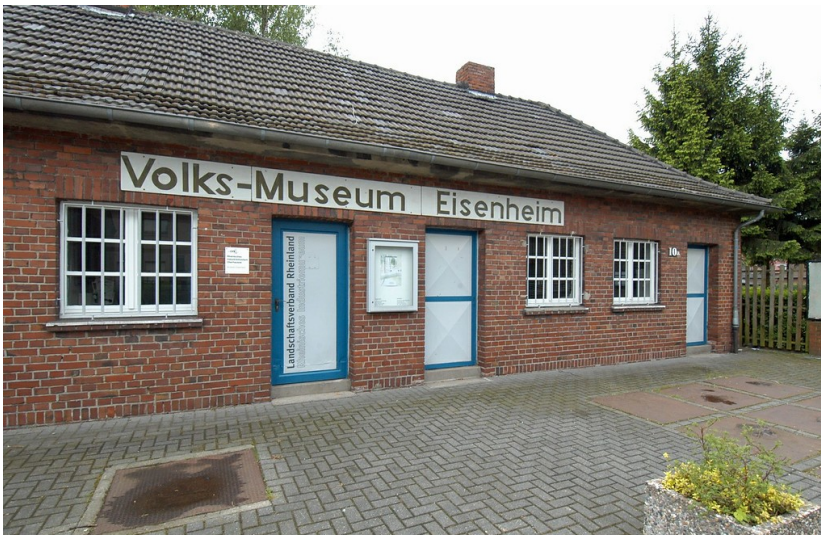
Museum Eisenheim (LVR-Industriemuseum)