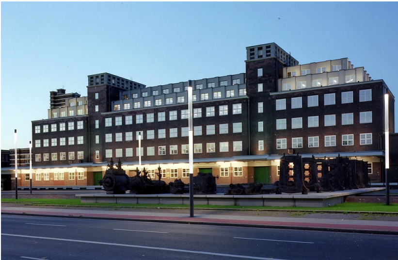
Peter-Behrens-Bau, LVR-Industriemuseum (2012).