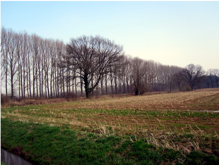
Baumreihe und Einzelbäume südlich des Paulshofs im Uedemerbruch (2011)