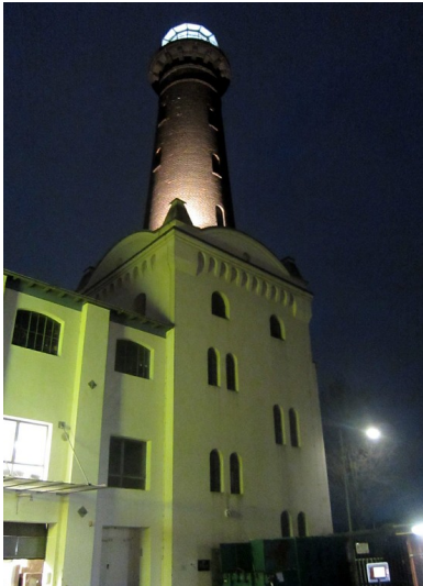
Der Leuchtturm der früheren Helios-Elektrizitäts AG in Köln-Ehrenfeld mit abendlicher Beleuchtung (2012).